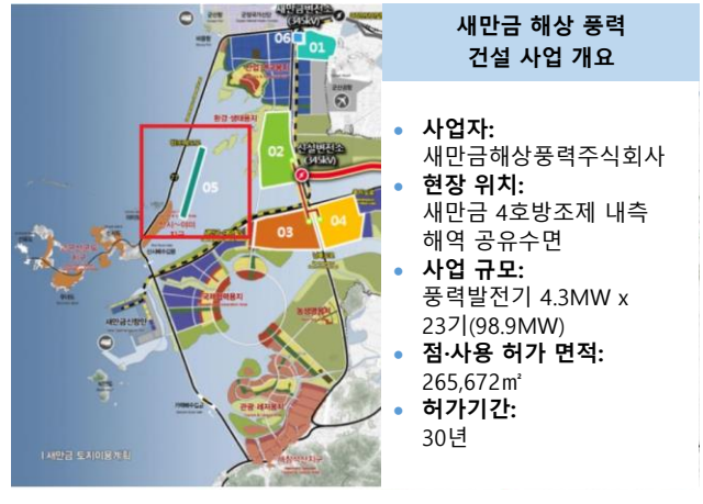
Fig. 02: 한미글로벌 새만금 해상 풍력 수주